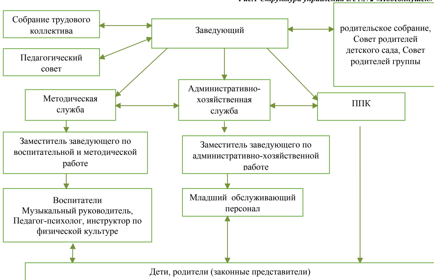
Рис.1 Структура управления д/с №72 «Подсолнушек»

Все службы детского сада принимают участие в эффективно действующей в детском саду системе управления: методическая (заместитель заведующего детским садом по воспитательной и методической работе, методический совет), психолого-педагогическая (педагог-психолог, члены ППК) административно-хозяйственная (заместитель заведующего детским садом по административно-хозяйственной работе) (рисунки 1).